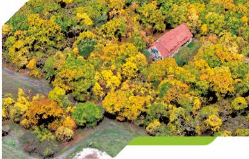
Jenaer Forst als 3D-Punktwolke, aufgezeichnet mit DJI Mavic Pro (Autoren: Christian Thiel & Andre Gräf)

Deutsches Zentrum für Luft- und Raumfahrt, Institut für Datenwissenschaften