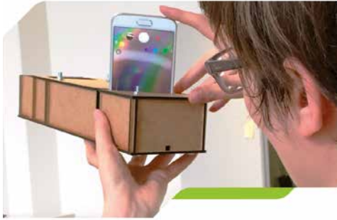
Spektrometer, Marke Eigenbau, im Einsatz während eines DIYBio-Workshops in Heidelberg.